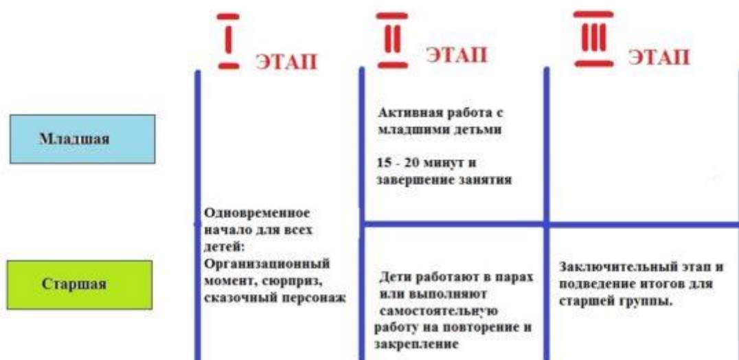
СХЕМА ПРОВЕДЕНИЯ ЗАНЯТИЯ С ПОЭТАПНЫМ ОКОНЧАНИЕМ

Примерный объём организованной – образовательной деятельности в разновозрастной группе